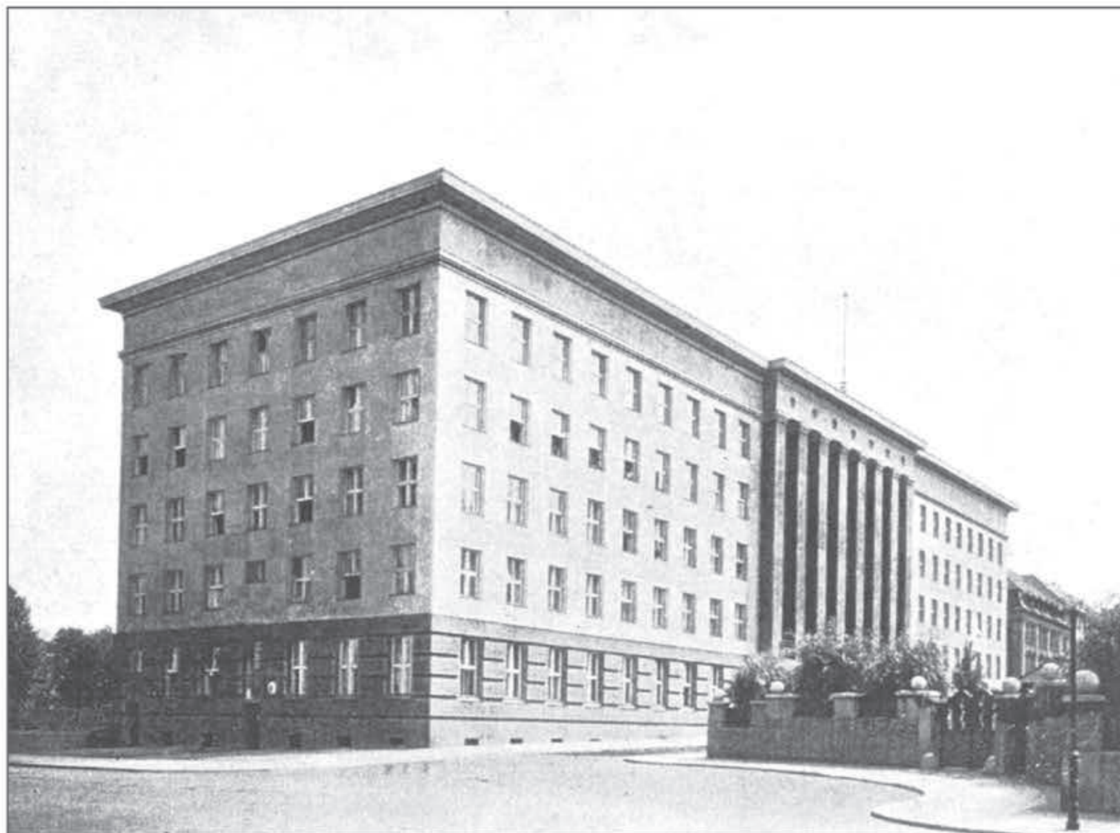
GMACH ADMINISTRACYJNY CENTRALI SYNDYKATU POLSKICH HUT ŻELAZNYCH W KATOWICACH